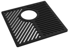
Rejilla Black 8100 651